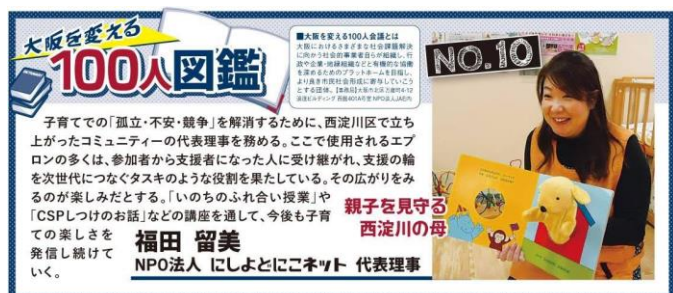
ベイコム・地元ニュース (大阪版) 2017 年 10 月 10 日号

(事業の成果) HP や SNS などを積極的に活用して運営施設や各プロジェクトの情報発信ができた。 また、取材や施設見学を通して広域に法人の取り組み紹介ができた。